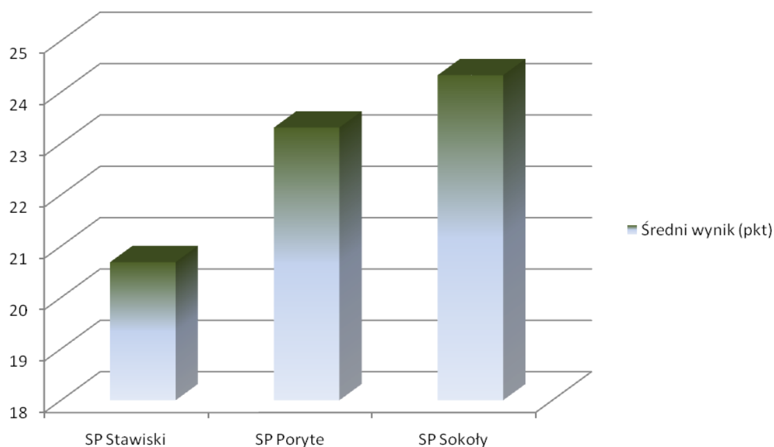
Wykres 1. Porównanie wyników ze sprawdzianu w klasach VI szkół podstawowych z terenu gminy Stawiski w roku szkolnym 2008/2009.

Najlepszy wynik w gminie, wg statystyk, uzyskała Szkoła Podstawowa w Sokolach. Wynika to z faktu, iż do egzaminu w tej szkole przystąpiło tylko 3 uczniów. Najśłabszą w rankingu okazała się Szkoła Podstawowa w Stawiskach, w której zdawało 81 uczniów.