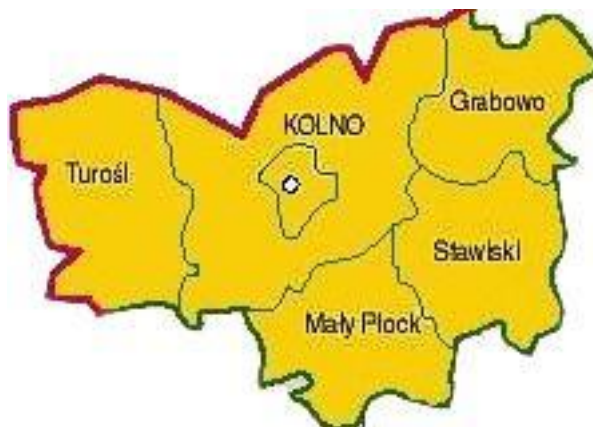
Położenie Stawisk w Powiecie Kolneńskim

Miejscowość: Stawiski (siedziba gminy). Posiadają prawa miejskie. Są jednocześnie sołectwem.